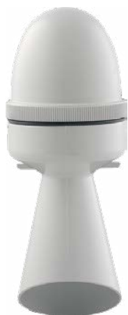
SEM SEM PLUS