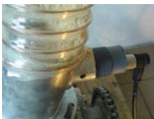
Détection de bourrage

La sciure, des copeaux ainsi que des granulés de bois peuvent être surveillés dans des silos ainsi que pendant leur transport, soit pour le contrôle de niveau soit pour la détection de bourrage.