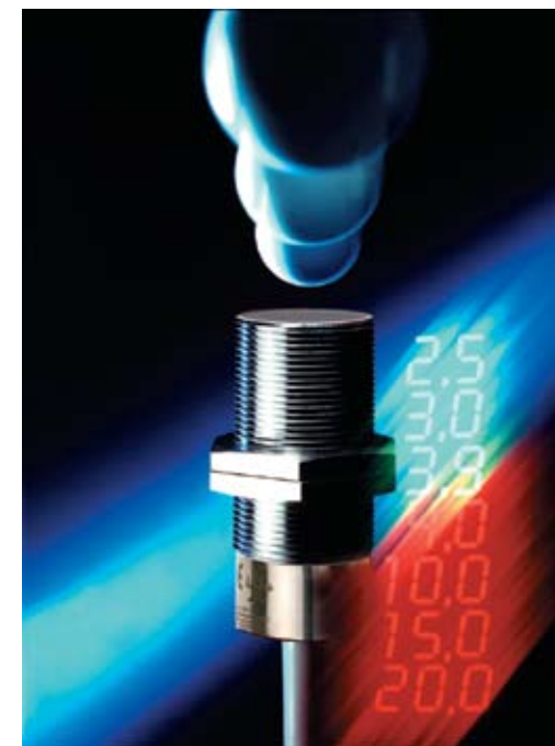
Capteurs capacitifs avec sortie analogique 4...20mA

Pour le choix des capteurs il est déterminant, en premier lieu, de savoir si la détection doit se faire „en contact“ avec le produit à contrôler ou à distance (au travers d'une paroi non métallique