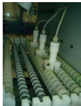
Série 26 - Contrôle de niveau dans la production de circuits imprimés