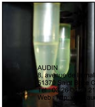
Contrôle de niveau de liquide dans des ampoules

Les capteurs capacitifs détectent des produits chimiques sous forme liquide, pâteuse, poudreuse ou granuleuse. Des capteurs spécifiques ont été développés pour la détection de substances très conductrices, comme celles que l'on rencontre fréquemment dans l'industrie des semi-conducteurs.