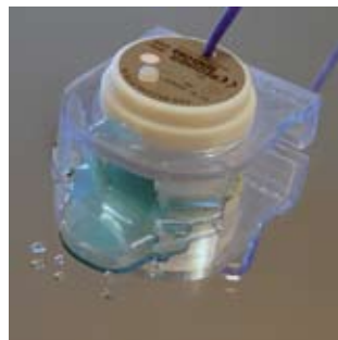
Capteur LEAK pour détection de fuites

Les capteurs LEAK pour détection de fuites appartiennent également à cette série.