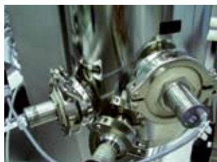
Contrôle de niveau

Ces capteurs sont idéaux pour les installations d'alimentation automatisées.