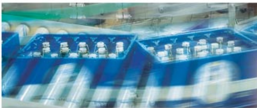
Advanced Industrial Automation

Vous gagnez du temps dans la programmation et les tests tout en améliorant la flexibilité de la machine.