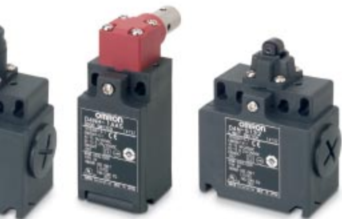
D4NH Interrupteur à arbre

Cet interrupteur de porte de sécurité dans un dispositif de sécurité est conçu pour les applications de verrouillage qui exigent un profil étroit. Il présente une force de retenue impressionnante de 1000 N qui permet d'atteindre un niveau de sécurité exceptionnel au niveau des portes.