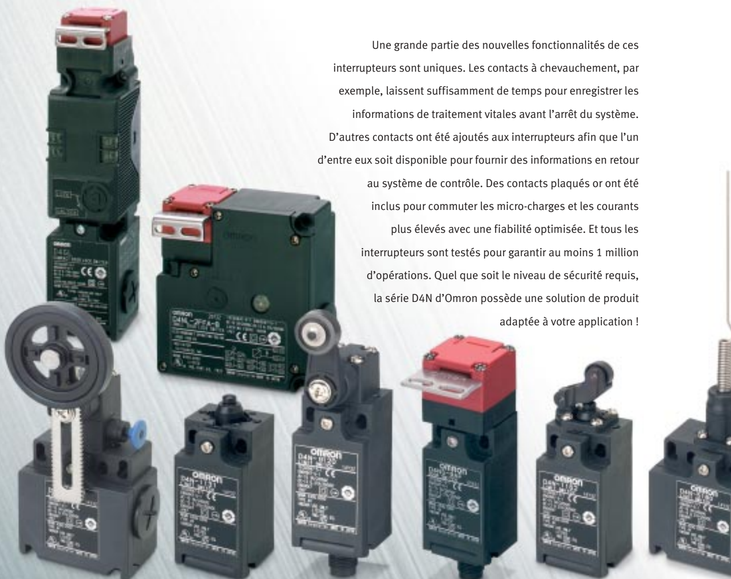
L D4NR Galet en caoutchouc

Une grande partie des nouvelles fonctionnalités de ces interrupteurs sont uniques. Les contacts à chevauchement, par exemple, laissent suffisamment de temps pour enregistrer les informations de traitement vitales avant l'arrêt du système. D'autres contacts ont été ajoutés aux interrupteurs afin que l'un d'entre eux soit disponible pour fournir des informations en retour au système de contrôle. Des contacts plaqués or ont été inclus pour commuter les micro-charges et les courants plus élevés avec une fiabilité optimisée. Et tous les interrupteurs sont testés pour garantir au moins 1 million d'opérations. Quel que soit le niveau de sécurité requis, la série D4N d'Omron possède une solution de produit adaptée à votre application !