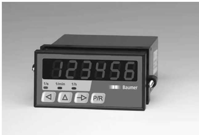
TA200 - Tachymètre LED