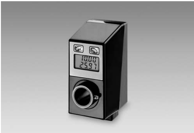
N 152 avec sortie câble