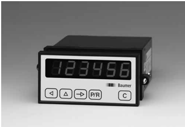
N 214 - Totalisateur