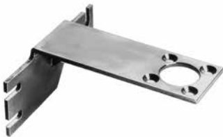
Équerre de fixation (accessoire)