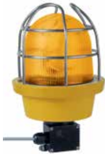
Panier de protection (accessoire)