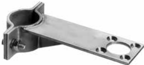
Adaptateur pour tube (accessoire)