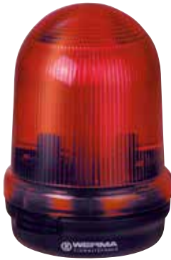
Fixation sur fond plat/sur équerre