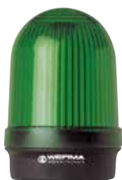
Feu fixe 210 (Fixation sur fond plat)