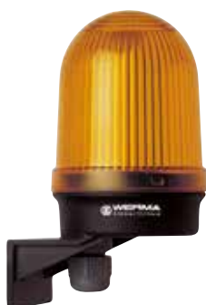
Feu fixe 213 (Fixation sur équerre)