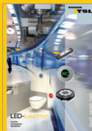
Eclairages à LED