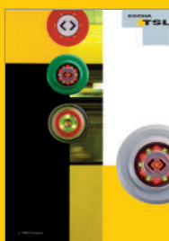
Boutons de demande d'ouverture des portes