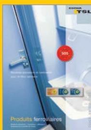
Contrôle de niveau/Bloc sanitaire

ESCHA TSL GmbH Elberfelder Str. 1 . 58553 Halver Service commercial: Tel: +49 2353 66796-0 . Fax: +49 2353 66796-99 info@escha-tsl.de . www.escha-tsl.com