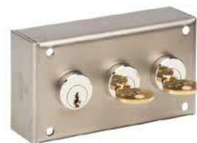
Réf : ELC12

État final: Clé 1 prisonnière, Clés 2 & 3 libres