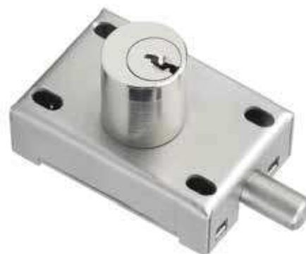
Réf : EL11AP