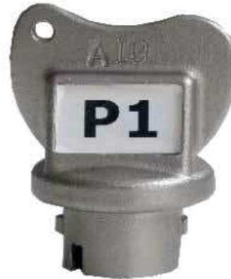
Réf : CQC

En cas de modification de serrure demandée après installation, sur site nos techniciens équipés d'outils spéciaux pourront modifier les codes des serrures et des clés et les recoder selon les nouvelles exigences du client.