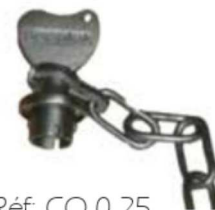
Réf: CO 0.25