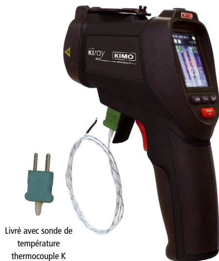
Livré avec sonde de température thermocouple K

Le thermomètre infrarouge KIRAY 400 est utilisé pour diagnostiquer, inspecter et vérifier n'importe quelle température. Son système optique élaboré à double visée laser et son écran TFT couleur permettent une prise de mesure facile et précise de petites cibles éloignées. Les fonctions vidéos et photos sont disponibles sur ce thermomètre. Il est possible de brancher une sonde thermocouple de type K.