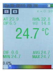
Point de rosée