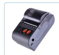
Imprimante Bluetooth® (Si-AQ Imprimante BT)