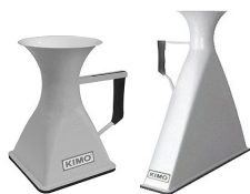
Cônes de débit Gamme de mesure de 10 à 1200 m 3 /h selon modèle