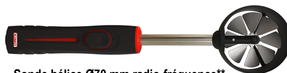
Sonde hélice Ø70 mm radio-fréquence** Gamme de mesure de -5 à 35 m/s, de 0 à 99 999 m 3 /h et de -20 à +80 °C