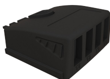
Module 4 voies thermocouple (M4TC) Gamme de mesure de -200 à +1760 °C (selon thermocouple)