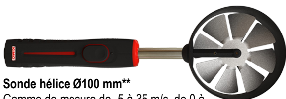
Sonde hélice Ø100 mm** Gamme de mesure de -5 à 35 m/s, de 0 à 99 999 m 3 /h et de -20 à +80 °C