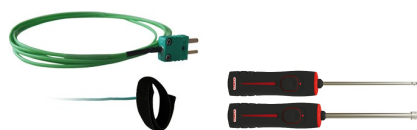
Large choix de sondes (voir fiche technique associée) : ambiance / contact / pénétration / immersion...

*Existe également en modèle radio-fréquence