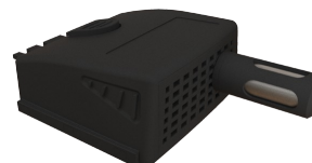
Module conditions climatiques (MCC) Gamme de mesure de 0 à +50 °C, de 800 à 1100 hPa et de 5 à 95% HR