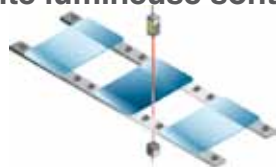
Détection de l'opacité du verre

Ces capteurs sont sensibles aux différences d'intensité lumineuse même très légères et peuvent ainsi évaluer l'opacité du verre et la turbidité des liquides. De plus, la quantité de lumière reçue peut être affichée en pourcentages afin de déterminer les taux de perméabilité.