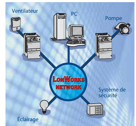
Variateur FR-F740/F746 dans un réseau LonWorks