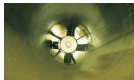
Système d'extraction 110 kW

Les systèmes d'extraction et de ventilation nécessitent généralement des moteurs très puissants. Les fonctions intelligentes de commande des moteurs de la Série FR-F740/746 réduisent les courants de démarrage et donc les frais dus aux surcharges de puissance. De même, le système diminue les frais de fonctionnement en faible charge.