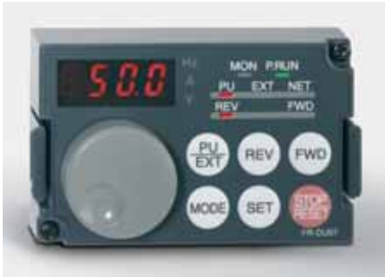
Pupitre opérateur FR-DU07