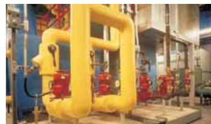
Système de pompage

Grâce à leur fonction de commande de plusieurs moteurs, les variateurs FR-F740/746 peuvent se charger de quatre moteurs dans un système de pompage avec des valeurs de consigne préétablies. Dans ce système, la fréquence d'un moteur est contrôlée par le variateur FR-F740/746, alors que les autres moteurs sont automatiquement connectés ou déconnectés du réseau par étapes. Cette gestion très efficace des moteurs est particulièrement utile dans les systèmes d'alimentation en eau qui exigent une réponse rapide et flexible (par exemple pour répondre aux variations soudaines de demande en eau).