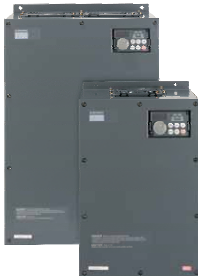
Variateur de fréquence FR-F746

Une récente étude de satisfaction effectuée par IMS Research a confirmé que les commandes Mitsubishi Electric figurent parmi les meilleures dans leur catégorie.