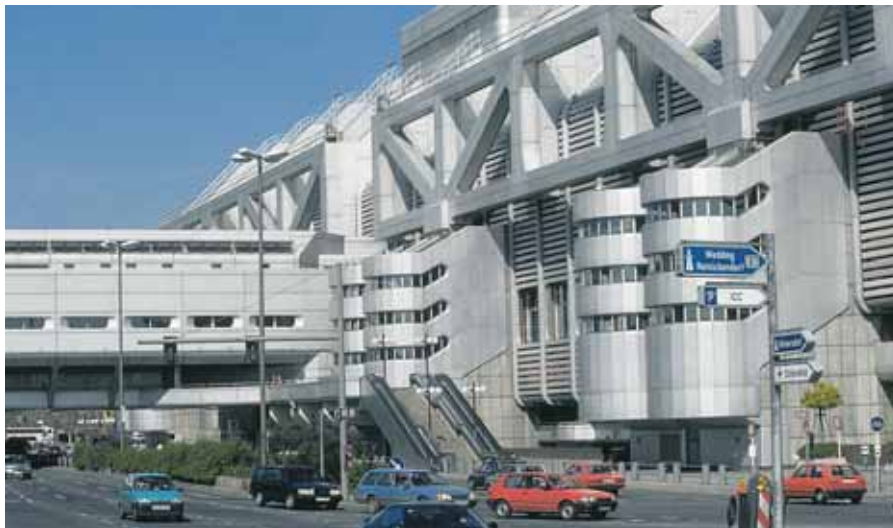
Solutions d'automatisation des services complexes de climatisation des bâtiments