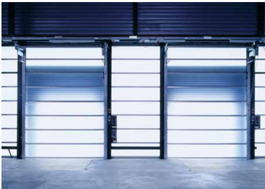
Les entraînements de portes et de ponts ne sont qu'une des applications de la série FR-D700.