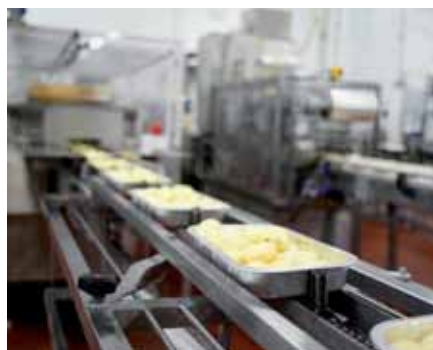
Les bandes transporteuses et les convoyeurs à chaîne conviennent particulièrement au FR-D700.