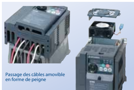
Passage des câbles amovible en forme de peigne

Les ventilateurs ont été conçus comme des unités compactes qui se remplacent en