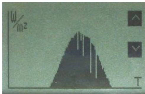
La représentation graphique 00H /24H

Défilement des graphes successifs 00H-24H