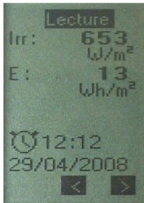
Valeurs stockées horodatées