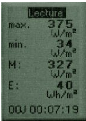
Les valeurs globales