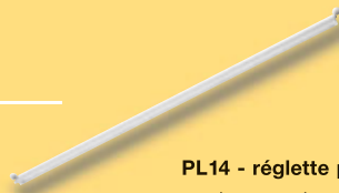
PL14 - réglette pour montage en dessous du plan de travail