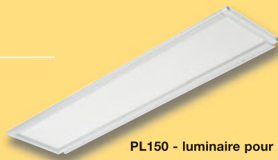
PL150 - luminaire pour montage au-dessus du plan de travail