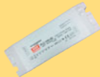
Alimentation 48V pour PL150 et PL14 Article No. 8701525