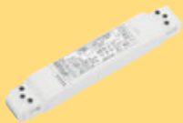
Variateur pour PL14 LED-PWM Article No. 8701218