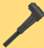
Cable de raccordement pour PL150 et PL14 Article No. 8701325

ESCHA TSL GmbH Elberfelder Str. 1 · 58553 Halver · Germany Service commercial: Tel.: +49 2353 66796-0 Fax: +49 2353 66796-99