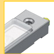
Connecteur M8 entrée + sortie