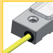
Connecteur M8 ou M12 Câble latéral