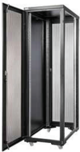
Racks Série RE