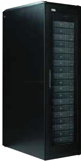
Racks Série RP