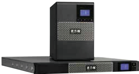
Disponible en format tour et rack 1U