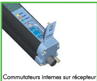
Commutateurs internes sur récepteur