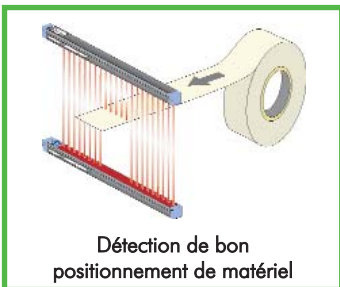
Détection de bon positionnement de matériel