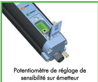
Potentiomètre de réglage de sensibilité sur émetteur