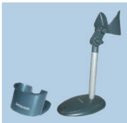
SPC Heron™ G et STD Heron™ G