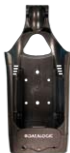
Chargeur pour véhicule