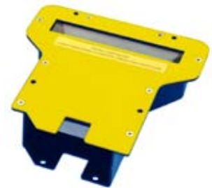
Miroir courte distance de lecture