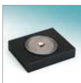
Magnetbasis Support magnétique