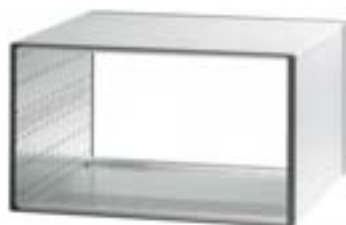
Boîtier sans aération, 6 U

Remarque : Conditions de montage selon DIN IEC 60297-3-101