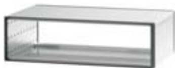
Boîtier sans aération, 3 U