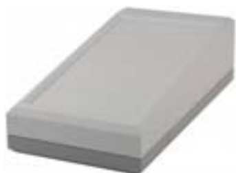
Boîtier avec surface pour clavier membrane en une partie