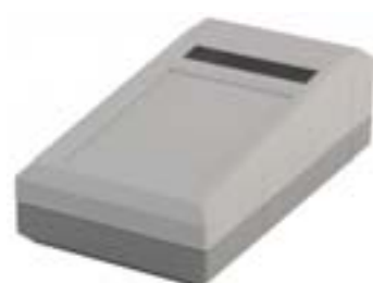
Boîtier avec vitre pour afficheur et surface pour clavier membrane

Fourniture : Parties supérieure et inférieure, 4 vis de fixation, face arrière