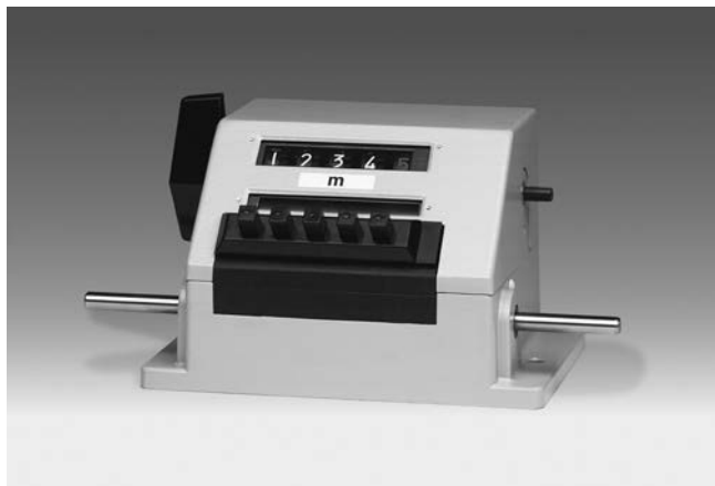
ME280 - Compteur métreur