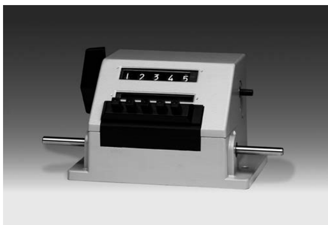
UE280 - Compteur de tours