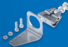
Kit de fixation Sensofix Série 18

2 m : ESW 33AH0200 5 m : ESW 33AH0500 10 m : ESW 33AH1000