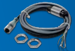
Convertisseur 3 points (M12)