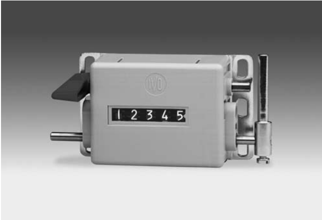
H 310 - Compteur d'oscillations