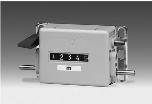
M 310 - Compteur mètreur