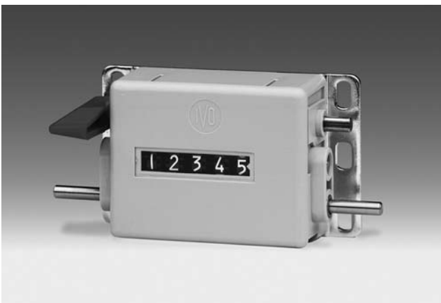
U 310 - Compteur de tours